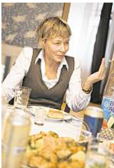
Besuch in einem russischen Haushalt: Leckereien, aber auch Alltagsprobleme kommen auf den Tisch!