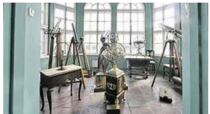
Der berühmte Basler Mathematiker Leonhard Euler forschte und lehrte am Hof Peters des Grossen.

Paläste und Stadtvillen aufwendig renovieren lässt. Zum richtigen Zeitpunkt benennt der Bürgermeister die Stadt wieder in Sankt Petersburg um. Heute ist die Stadt ein unvergleichliches Gesamtkunstwerk voller historischer und architekto-